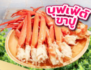
บุฟเฟต์ บายู