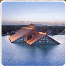
พิพิธภัณฑ์ไดน้ำกวางฟู่หลิน