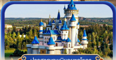
ปราสาทเทพนิยายซาโฮวา