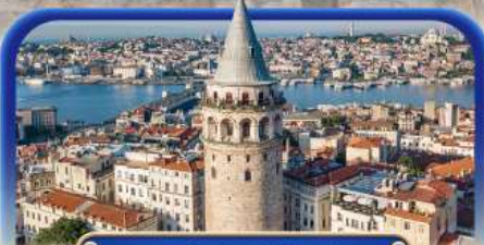
หอคอยกาลาตา