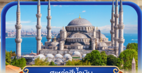
สุหร่าสีน้ำเงิน