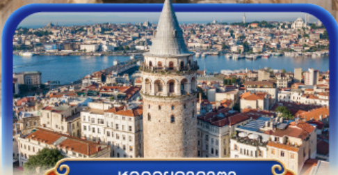
หอคอยกาลาตา