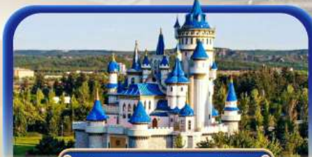
ปราสาทเทพนิยายซาโซวา