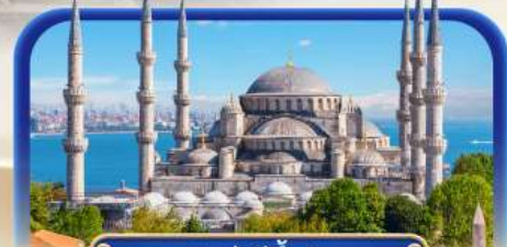
สุเหร่าสีน้ำเงิน

เที่ยวเมืองอันตัลยา บรรยากาศริมทะเลเมดิเตอร์เรเนียน