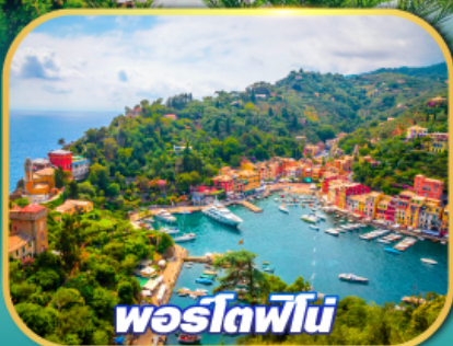
พอร์ตฟีโน