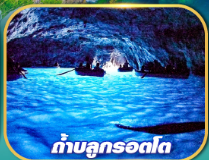
ถ้ำบลูกรอตโต