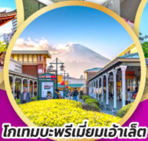
โทเกมะพรีเมียมเฮ้าส์