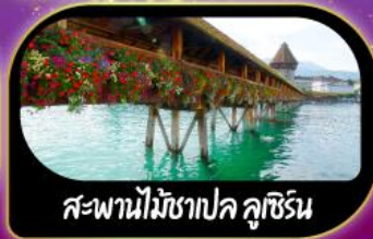
สะพานไม้ชาเปล คูชีริน