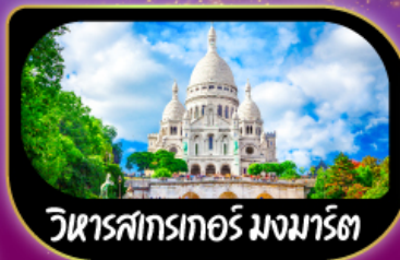
วิหารสกรเกอร์ มงมาร์ต