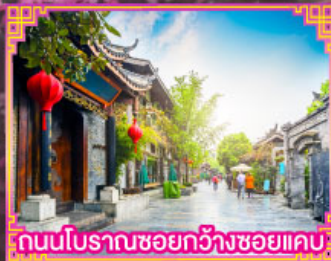
ถนนโบราณชอยกวิ้งชอยแคบ