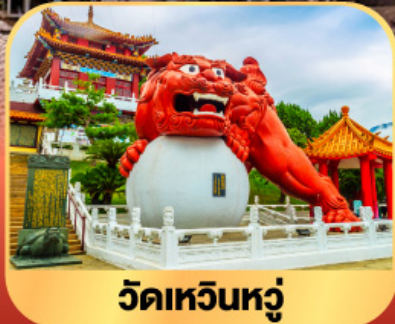
วัดเหวินหู