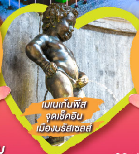
เมเนกันพิส จุดเช็คอิน เมืองบรัสเซลส์