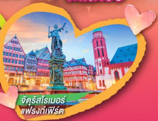
จัตุรัสโรเมอร์ แฟรงก์เฟิร์ต