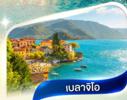
เบลลาจีโอ