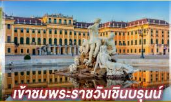
เข้าชมพระราชวังฮินบรุนน์