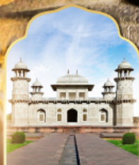
ทัชมาฮาลน้อย

31 พ.ค.-06 มิ.ย. 69 วันเฉลิมพระราชินี 25-30 ก.ค. 69 วันเฉลิมรัชการที่ 10 21-26 ต.ค. 69 วันหยุดปีมะหาราช ถ้ำมรดกโลก เที่ยวได้ตลอดปี