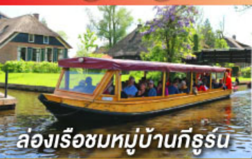
ล่องเรือชมหมู่บ้านกังธูร์น