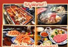
บุฟเฟ่ต์ญี่ปุ่น บิงข่างยากิโทโกอิน Steakland Kobe