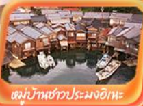
หมู่บ้านชาวประมงอิเกะ