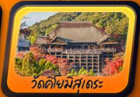
วัดคิโยมิสุเดะะ

พักฟูจิออนเซ็น 1 คืน กิฟุ 1 คืน โทยาม่า 1 คืน นาริตะ 1 คืน