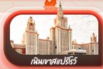
เหมินเขาสเปิร์ริว