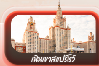
เนินเขาสเปร์โรว์