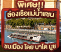
พิเศษ!! ล่องเรือแม่น้ำแซน ชมเมือง โดย บาโต มุช