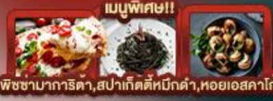
เมนูพิเศษ!! พิซซ่ามาการิตตา, สเปากัดตีหมักดำ, หอยเอสคาโต