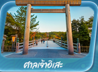
ศาลเจ้าอิสะ

12 - 17 พ.ค. 69 / 19 - 24 พ.ค. 69 26 - 31 พ.ค. 69 / 2 - 7 มิ.ย. 69 9 - 14 มิ.ย. 69