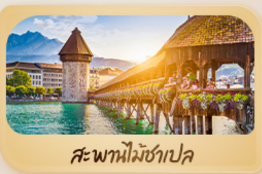
สะพานไม้ม้าเปลา

25 มี.ค. - 01 เม.ย. 69 / 04-11 เม.ย. 69 08-15 เม.ย. 69 / 28 เม.ย. - 05 พ.ค. 69 27 พ.ค. - 03 มิ.ย. 69