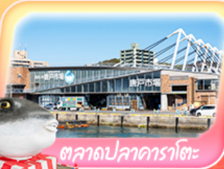
ตลาดปลาอาราโตะ

ถ่ายภาพปราสาทโคคุระ ช้อปบิงจูโจที่ เอาเก้เล็คคิตะคิซุ