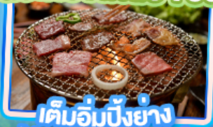
เต็มอิ่มปิ้งย่าง Yakiniku Buffet