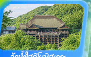
วัดน้ำใสคิโยมิกุเดระ