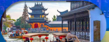
Zhujiajiao Ancient Town ล่องเรือเมืองโบราณ

เซี่ยงไฮ้ ดิสนีย์แลนด์ เมืองโบราณจูเจียเจียว