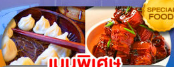
เมนูพิเศษ เสี่ยวหลงเปา หมูน้ำแดง เดินทาง ต.ค. 69 - มี.ค. 70