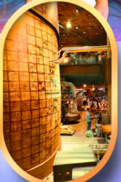
ร้านสตาร์บัคส์