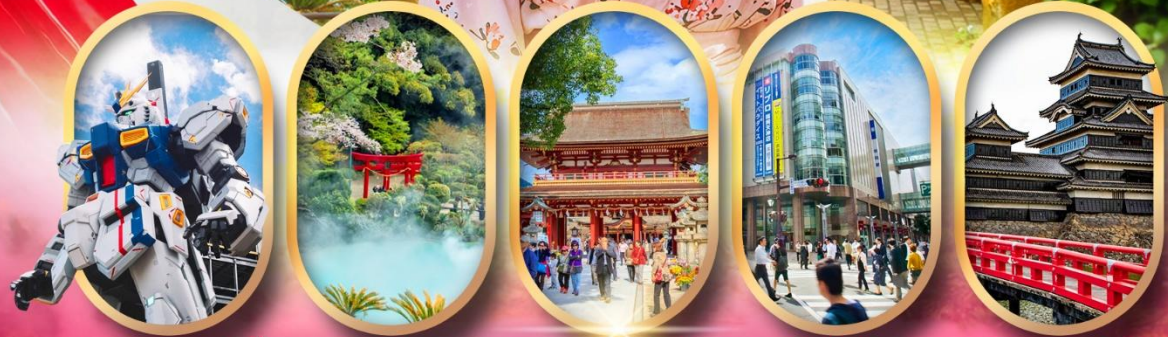
ห้างลาลาพอกันดั้ม อุมิจิกุคุ ศาลเจ้าดาไซฟุ ช้อปปิ้งย่านกินจิน ปราสาทคุมาโมโตะ