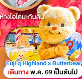
Fuji q Highland x Butterbear เดินทาง พ.ค. 69 เป็นต้นไป