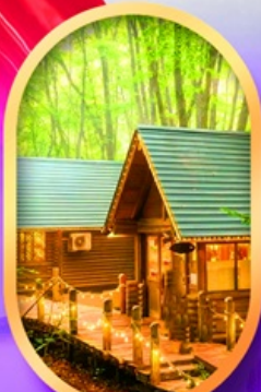
นิงเกิลเกอรัส