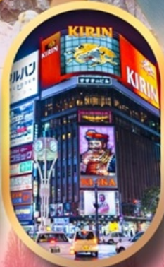
ช้อปปิ้งย่านซูซุกิโนะ