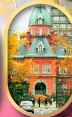
ศาลาว่าการเก่า