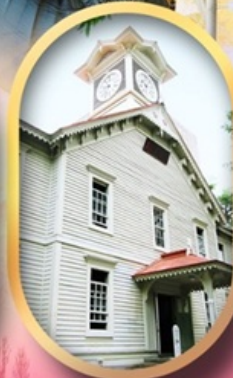
ผ่านชมหอนาฬิกา