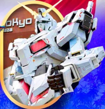
ห้างไอโดะกันดั้ม