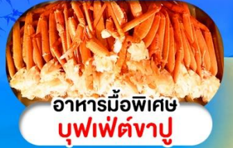
อาหารมือพิเศษ บุฟเฟ่ต์งาปู