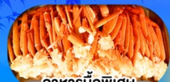
อาหารมือพิเศษ บุฟเฟ่ต์จปู