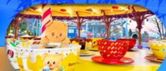
Fuji q Highland x Butterbear เดินทาง พ.ค. 69 เป็นต้นไป