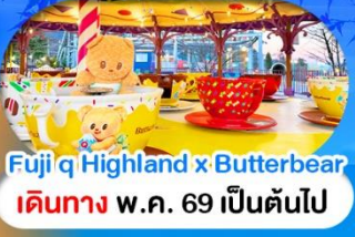
Fuji Q Highland x Butterbear เดินทาง พ.ศ. 69 เป็นต้นไป