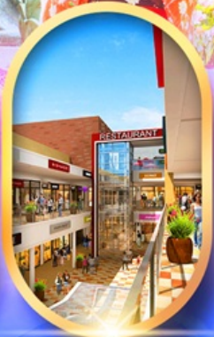
มิตซึเอะเก้ลิท