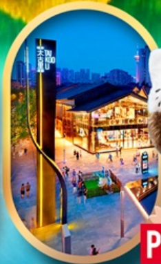
ถนนคนเดินไท่กู่หลี่