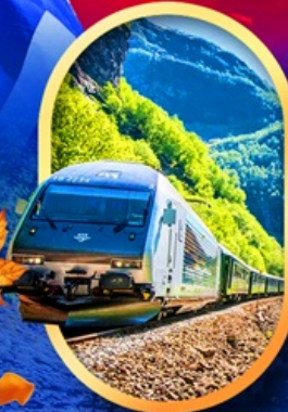
รถไฟฟลัมสนาน่า