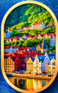
พิกเมืองเบอร์เก็น