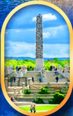
วิกเกอร์แลนด์