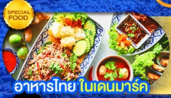
อาหารไทย ในเดนมาร์ก