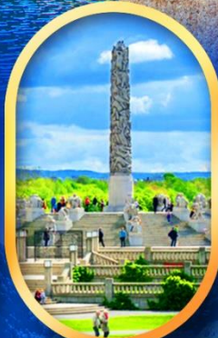
วิกเตอร์แลนด์