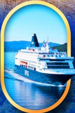
นั่งเรือ DFDS