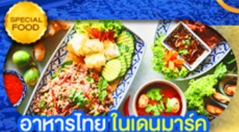
อาหารไทย ในเดนมาร์ก