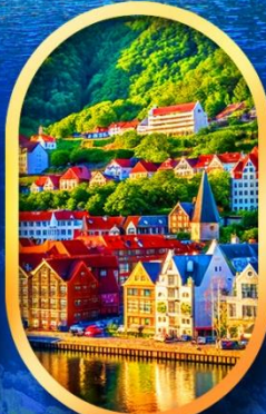
พักเมืองเบอร์เก็น