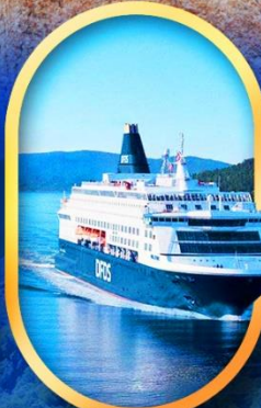
นั่งเรือ DFDS