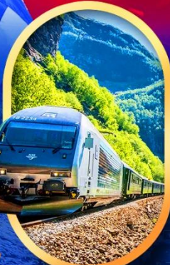
รถไฟฟลัมสนาน่า