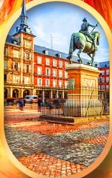
พลาซามายอร์