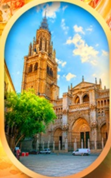
มหาวิหารโตเลโด