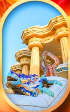
ปาร์ค กูเอล