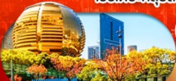
City Balcony จุดชมวิวชื่อดังในทางใจ

เชียงใหม่ หางโจว ดิสนีย์ สวนสนุกเลโก้แลนด์