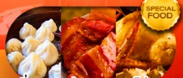
เมนูเสี่ยวหลงเปา หมูแดงพอโก้งกาน เดินทาง มี.ค. - มี.ย.69