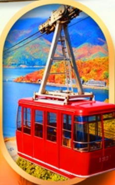
ขึ้นกระเช้าทะเลสาบมิดะตะ