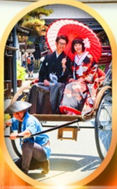
เมืองเก่าทาคายามา