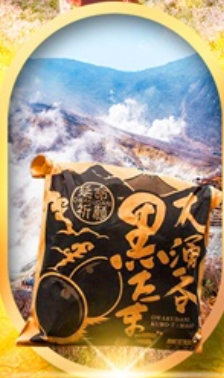
หุ่นเขาโอวาคุดานิ