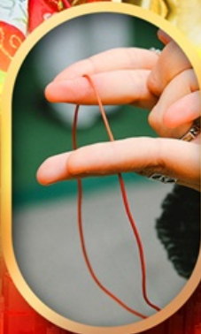
เสริมดวงความรัก