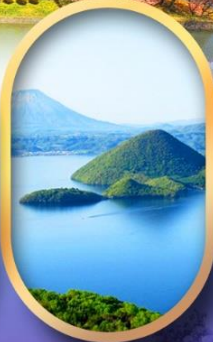
วิวทะเลสาบโทยะ