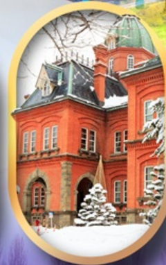
ศาลาว่าการฮอกไกโด