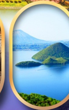
วิวทะเลสาบโทโยะ