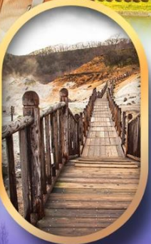
หุบเขาจิกุกุดาบิ