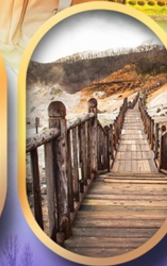
หุบเขาจิกอกุคานิ