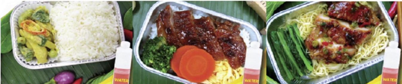
Green curry chicken with rice and water Chicken teriyaki with rice and water Chicken roasted with herb and noodle and water

*** เมนูอาหารอาจมีการเปลี่ยนแปลง ทั้งนี้ขึ้นอยู่กับเที่ยวบิน ***