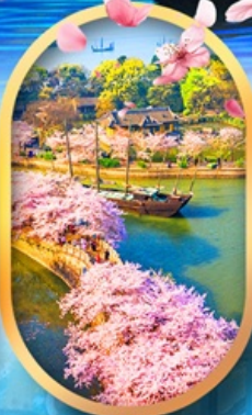
ล่องเรือสวนหยวนโถวจู