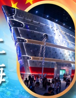
เรือคอะหลุยส์