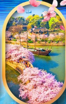
ล่องเรือสวนหยวนโถงจู่