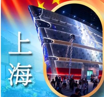
เรือคอะหลุยส์