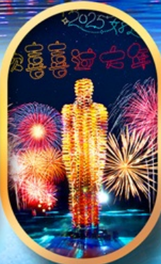
หมู่บ้านเนียนฮัววาน