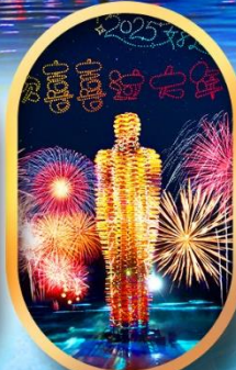
หมู่บ้านเนียนฮัววาน