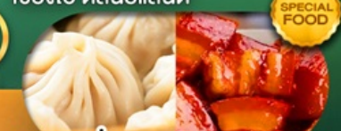
พิเศษ เสี่ยวหลงเปา หมูตงฟอ เดินทาง ม.ค. - มิ.ย. 69