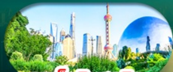
จุดเช็คอินสุดฮิต North Bund Shanghai

เซี่ยงไฮ้ หางโจว ล่องทะเลสาบซีหู ฟรีเดย์