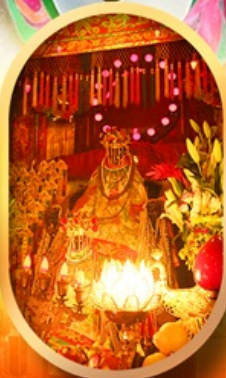
เจ้าแม่กวนอิมทองคำ