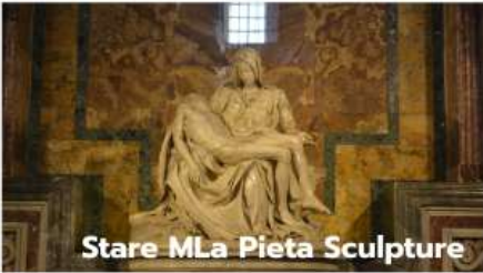
Stare MLa Pieta Sculpture