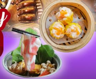
วัดเขกงหนิว