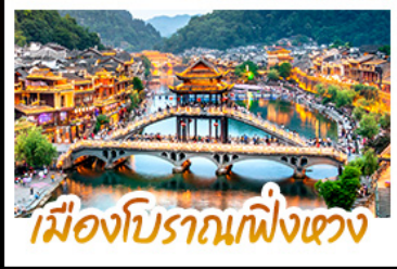
เมืองโบราณเฟิงเตา