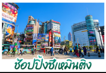
ซูปpingซีเหมินติง