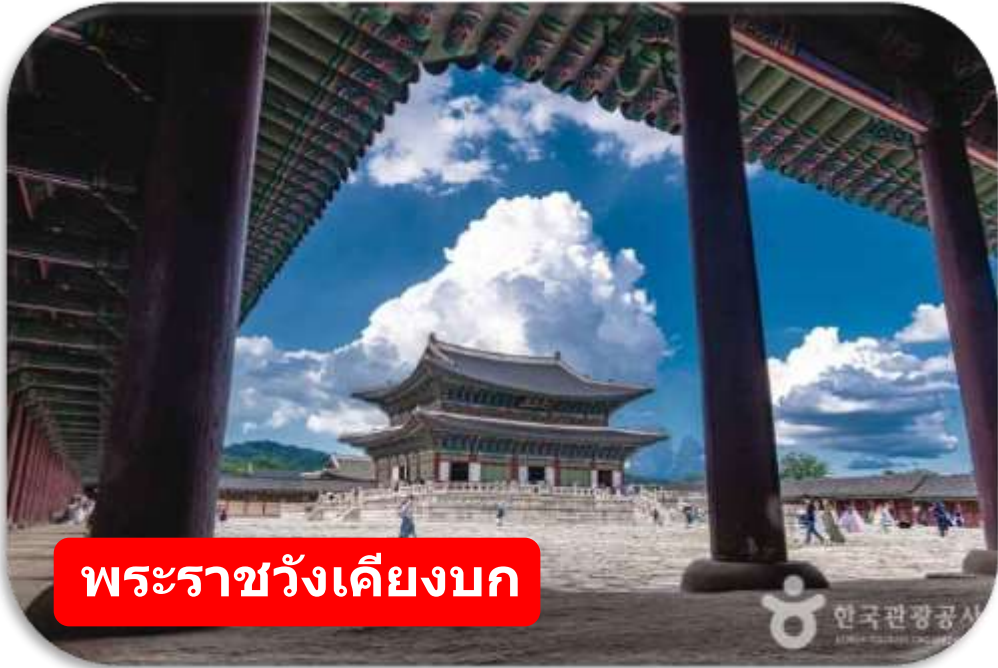
พระราชวังเคียงบก

พระราชวังเคียงบก (Gyeongbokgung) ไม่รวมค่าเช่าชุดฮันบก พระราชวังหลวงที่ยิ่งใหญ่ที่สุดของเกาหลี ท่านสามารถเดินถ่ายรูปภายในพระราชวัง ท่ามกลางสถาปัตยกรรมโบราณอันงดงาม ไม่ว่าจะเป็นห้องพระโรง ศาลาริมสระน้ำ และฉากภูเขาด้านหลังที่สวยงาม พร้อมทั้งเข้าชมพิพิธภัณฑสถานบ้านเกาหลี