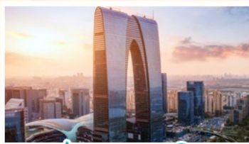
ประตูบูรพาทิศ