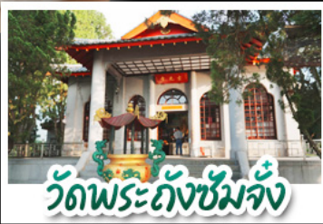
วัดพระถังซัมจั๋ง