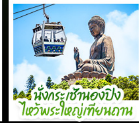
นั่งกระเช้าเองปีง ไหว้พระใหญ่เทียนถาน