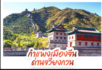
กำแพงเมืองจีน ถ่านจิวยงกวน

ล่องเรือสุดโรแมนติกแม่น้ำหวงผู้ ปักกิ่ง..เปิดประตูแดนมังกร ด้วยความอลังการระดับจักรพรรดิ ชิงเต่า..เมืองชายทะเลสไตล์ยุโรป หูหราบแบบผ่อนคลาย เซี่ยงไฮ้..มหานครแห่งเอเชีย เมืองที่ไม่เคยหลับใหล