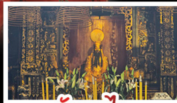
วัดกวนไท้