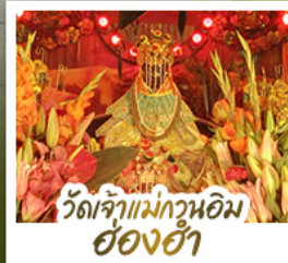
วัดเจ้าแม่กวนอิมฮ่งฮ่า