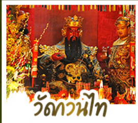
วัดกวนี่ไท