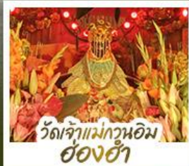
วัดเจ้าแม่กวนอิมอ่องฮ้่า