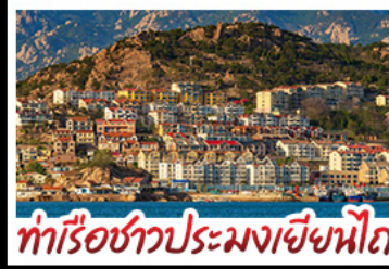
ท่าเรือชาวประมงเยียนโก